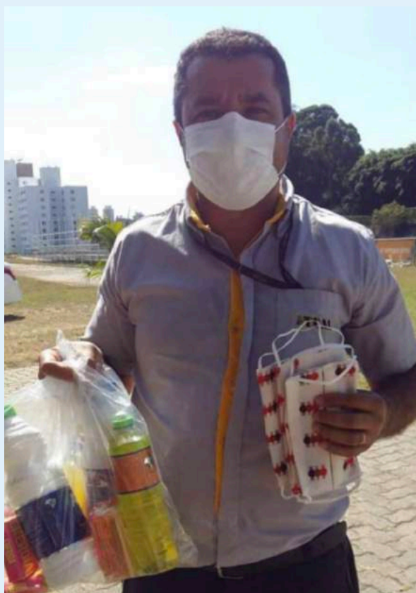
Pai de aluna do Projeto Meninas em Campo recebendo kits de higiene e máscaras doados pelos pais