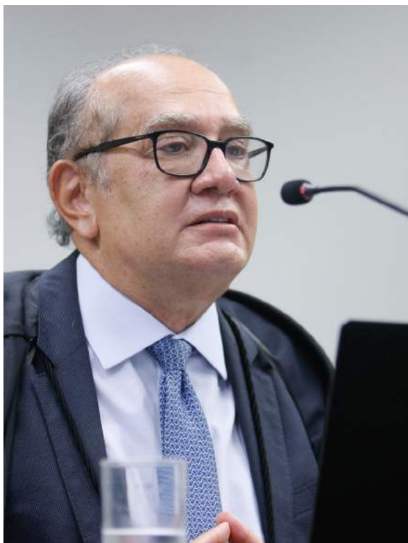
Ministro Gilmar Mendes

Na sequência do julgamento, a maioria do pleno do Supremo Tribunal Federal (resultado final: 6 x 5), rejeitou os embargos opostos pela União, mantendo a decisão preferida nos autos da ADI 4480, ao declarar diversos dispositivos considerados como contrapartidas, trazidos à baila pela Lei nº 12.101/2009, como inconstitucionais, válidos com efeito ex tunc , evidenciando que a letra da lei de-