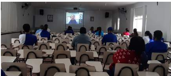
Manhã de formação, realizada pelo YouTube, sobre o Pacto Educativo Global.